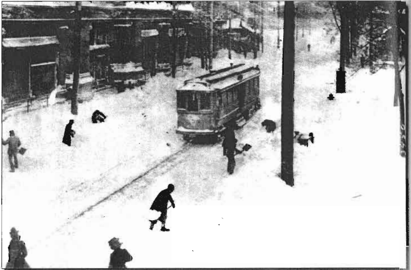
■ Cette photographie de William Notman montre la rue Sainte-Catherine à Montréal, en 1901, après une bordée de neige (Bibliothèque et Archives Canada)

pour des centaines de mots dans le français de référence (le français des dictionnaires), par exemple pour chavirer, envergure, mettre les voiles, (être, tomber) en panne , etc. qui s'emploient dans la vie de tous les jours et dont on a presque oublié l'origine maritime. Mais les façons de parler du peuple sont toujours suspectes aux yeux des chevaliers du bon langage. On trouve une dénonciation des mots maritimes à sémantisme élargi dans le premier recueil correctif canadien, celui de l'abbé Thomas Maguire ( Manuel des difficultés les plus communes de la langue française , Québec, 1841, p. 120-121) :